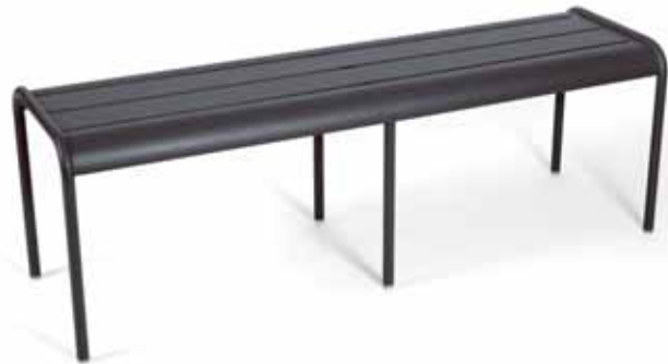
4110 Bench 3/4 places Bank 3/4 Personen