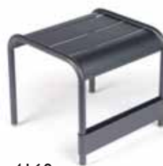
4160 Small low table / Footrest Kleiner niedriger Tisch / Fußteil