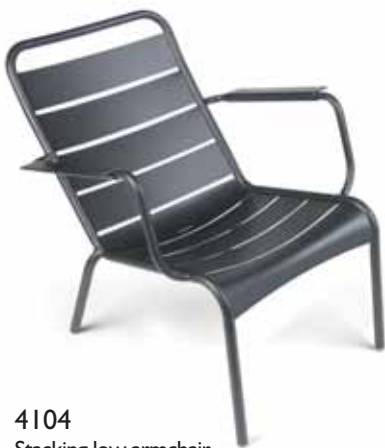
4104 Stacking low armchair Tiefer Sessel, stapelbar