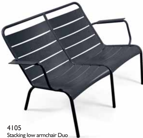
4105 Stacking low armchair Duo Tiefer Sessel Duo, stapelbar