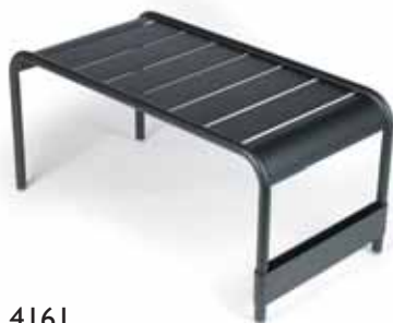
4161 Large low table / Garden bench Großer niedriger Tisch / Gartenbank