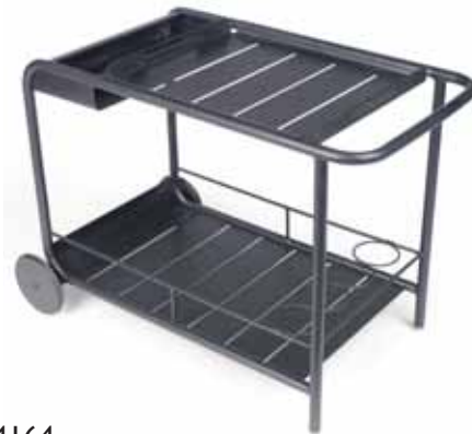
4164 Side table / Bar with wheels Removable top Ablage / Bar mit Rollen Abnehmbare Platte