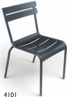
4101 Stacking chair Stuhl, stapelbar

Registered trademark Exklusives patentiertes Modell