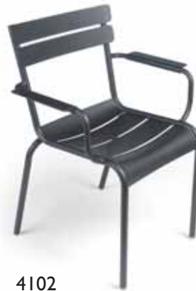
4102 Stacking armchair Bridge, stapelbar