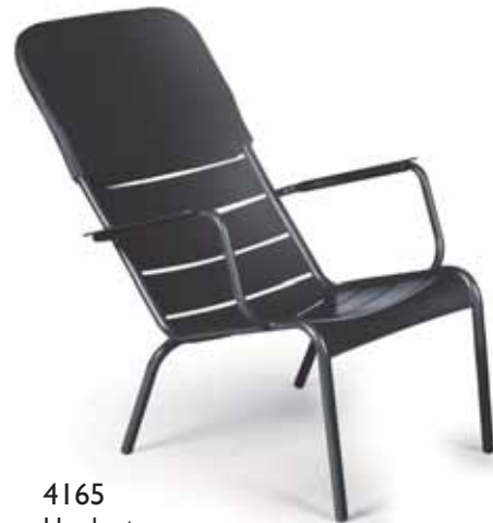
4165 Headrest Kopfstütze