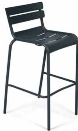
4103 Stacking high stool Stapelbarer Barhocker