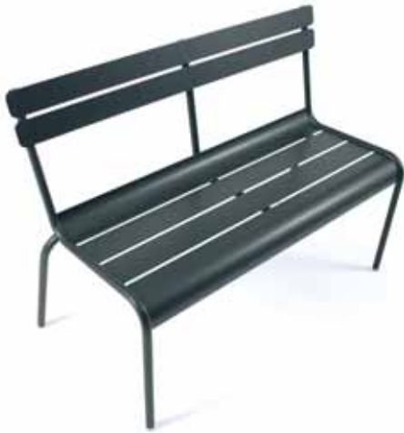
4115 Stacking bench 2/3 places Bank, stapelbar 2/3 Personen

Registered trademark Exklusives patentiertes Modell